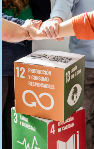
Grado en Educación Social