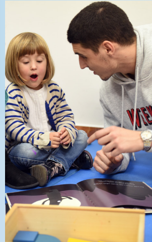
Grado en Maestro en Educación Infantil